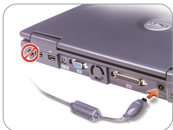
AC Adapter AC アダプタ 交流适配器