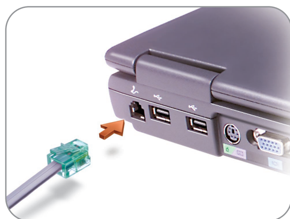
Modem Option モデムオプション 调制解调器选件