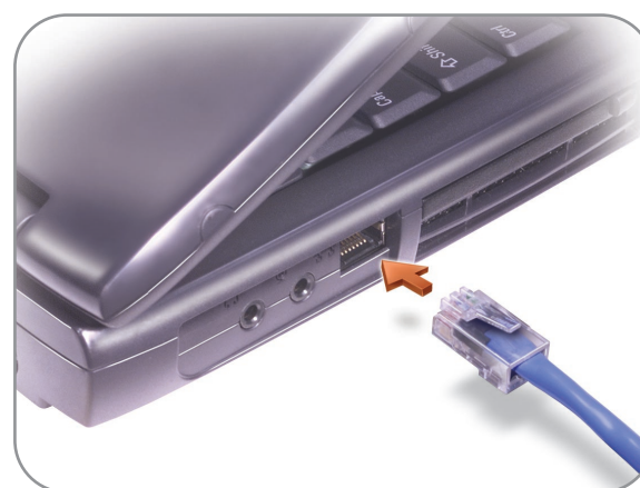
Network Option ネットワークオプション 网络选件